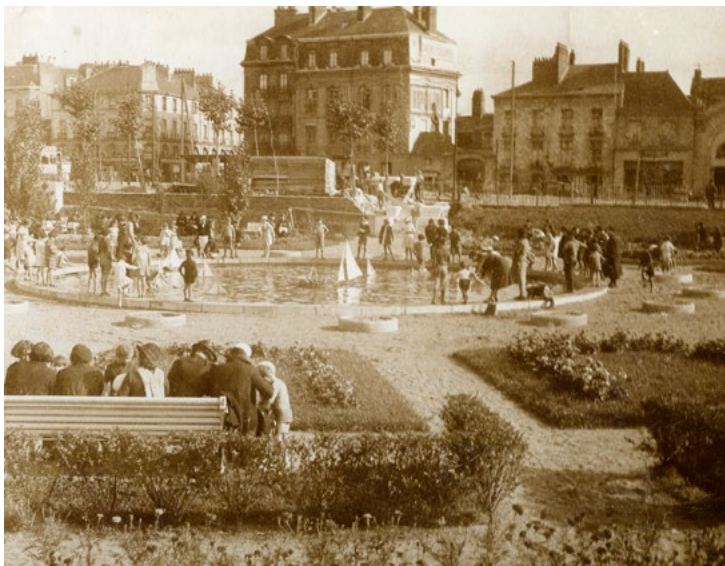
Le jardin à son ouverture au mois de septembre 1935.