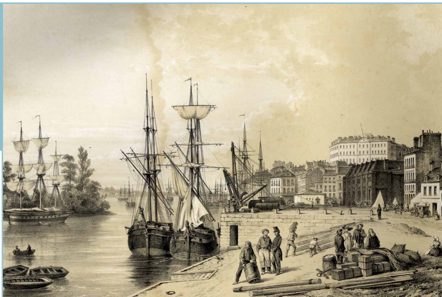
Entrée du port de Nantes, 1850, dessin par Félix Benoist, lithographie par A. Cuvelier.

Les visites sont animées par des guides-conférenciers agréés