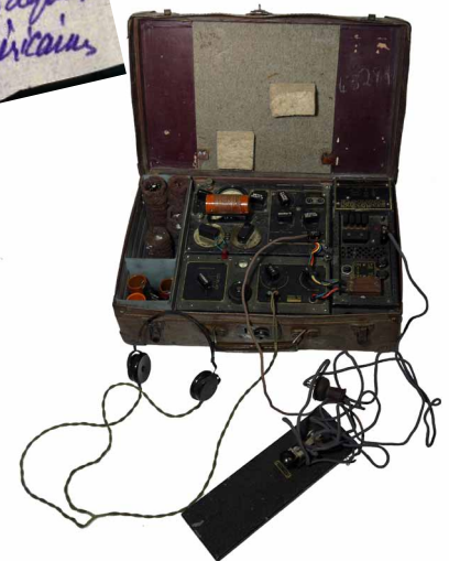
poste radio émetteur-récepteur des services secrets anglais